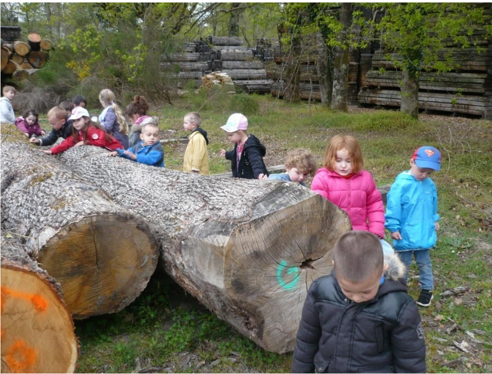
On a compté des cernes (l'âge du bois) : il y a des grumes de plus de 100 ans.