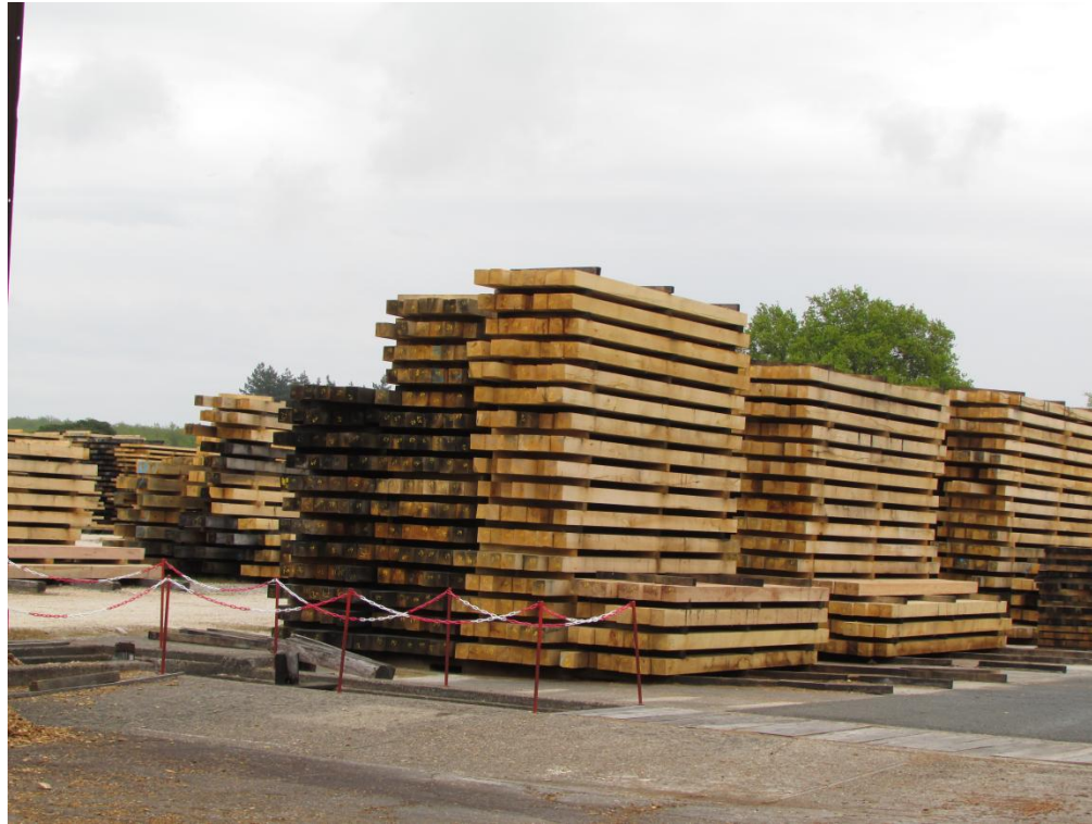
Ce sont les planches de chêne.