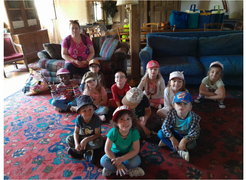
Un peu d'explications sur les abeilles et dégustation de miels de différentes saveurs.