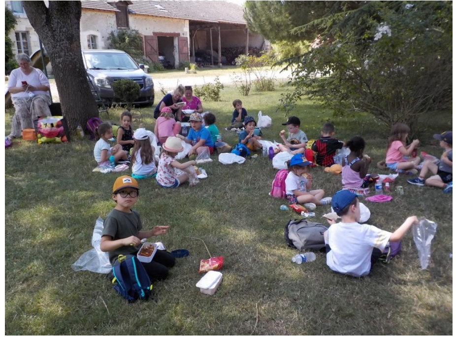
Moment pique – nique incontournable et repos bien mérité avant de retourner à l'école.