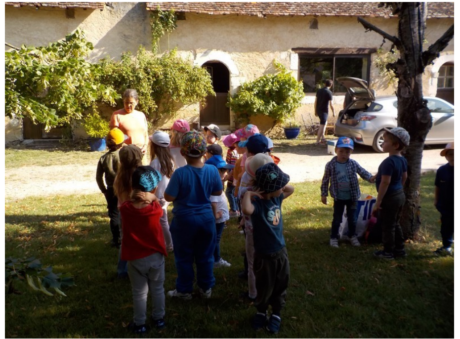
Petite visite historique du couvent de Glatigny