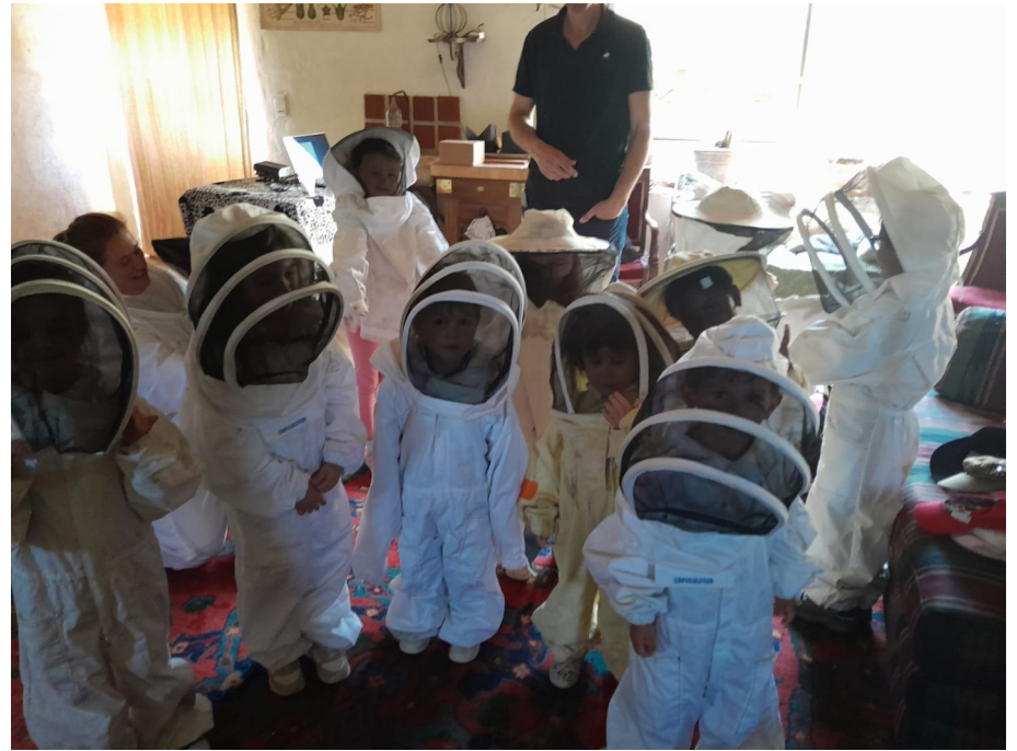
Equiperment avant d'aller voir les abeilles de très près.